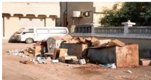
Un cas typique de la négligence d'un stockage approprié de déchet

MESC pourrait s'associer à une entité du gouvernement local pour former une entreprise commune qui assume pleinement la responsabilité et le contrôle des opérations par un contrat de concession négocié. Cette entreprise est chargée de la collecte et de l'élimination-à un bon rapport coût-efficacité- des déchets solides au niveau résidentiel et commercial utilisant les méthodes conventionnels de travail intensif ou les systèmes de conteneur les plus efficaces et les moins coûteux avec des véhicules de compression à déchargement frontal et arrière.