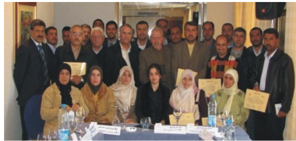
Les responsables et les formateurs irakiens

MESC a lancé en 2006-2007 avec un grand succès ses formations répondant ainsi aux besoins identifiés des organisations humanitaires opérant en Iraq, financées par le gouvernement américain.