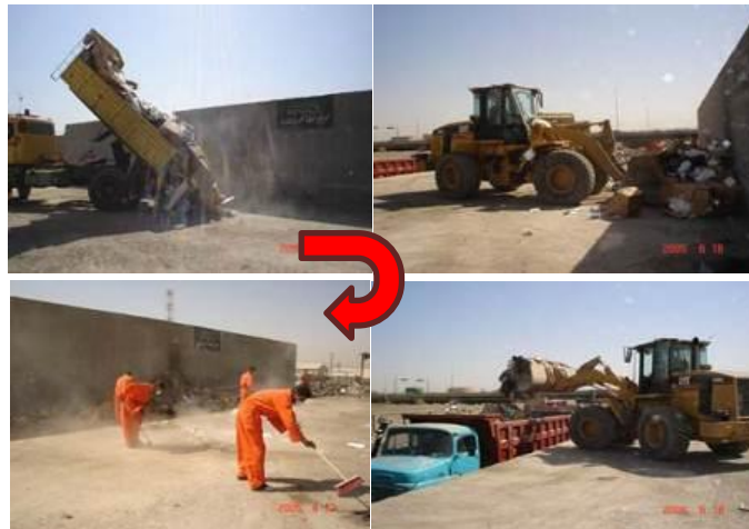
Station de transfert de base à Bagdad( Iraq) traitant 400 tonnes de déchets par jour

Selon la distance entre les routes de collecte et le site d'enfouissement final , MESC pourrait recommander l'introduction d'une station de transfert de déchets où les camions à benne déposent leurs charges qui seront groupés pour former un grand charge à transporter au site final. Ci-dessous une illustration d'un simple design fonctionnel et présentant en même temps un très bon rapport coût-efficacité. Sont disponibles d'autres systèmes de transfert plus élaborés où l'opération a lieu à l'intérieur d'un bâtiment pour éviter les problèmes de bruit, de trafic, et d'odeurs .Ces systèmes comportent également une composante de recyclage.