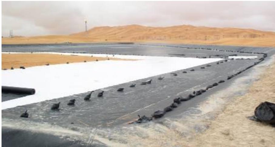
L'entreprise a installé une évaporation lac en Algérie

L'action principale de MESC est la fourniture et l'installation des revêtements en HDPE des matériels en Geogrille, géosynthétique, en GCL aux entreprises industrielles et aux services gouvernementaux.