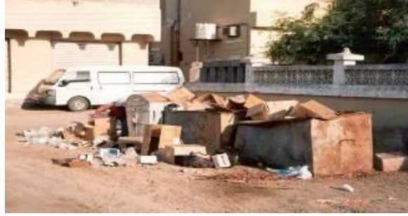
مشهد نمطي لمنطقة حضرية، حيث لم يتم تزويد المكان بحاويات مناسبة لجمع النفايات

تقوم عمليات جمع النفايات السكنية والتجارية التي تقوم بها الشركة الحديثة لخدمات البيئة على القضاء على المشاهد غير المستحبة كما هو مبين في الصورة أدناه . حيث يؤدي إنتشار النفايات وعدم معالجتها إلى إنتشار الفوضى وعكس صورة مشوهة للحكومة التي تبدو غير قادرة على إحاطة المواطنين بخدمات مناسبة لهم.