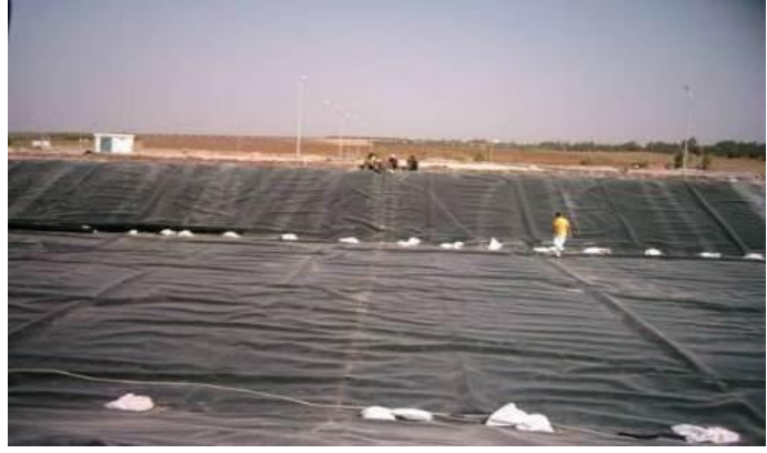
برك معالجة مياه الصرف الصحي