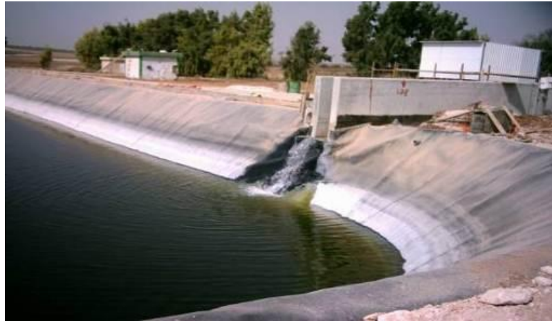
محطة معالجة مياه الصرف الصحي