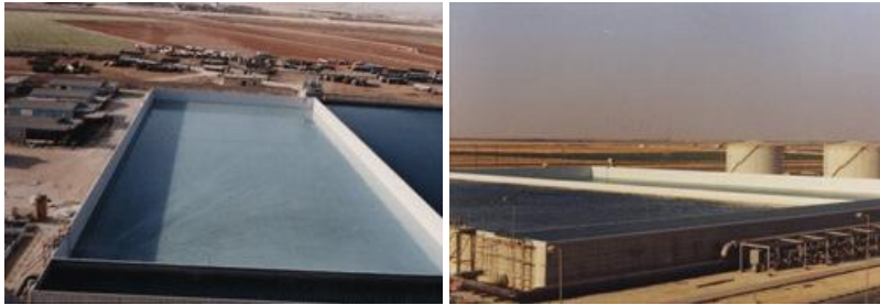
خزان مياه إحتياطي