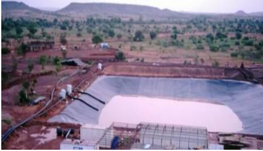
حوض لمياه الغسيل

يمكنكم مشاهدته أمثلة لتطبيقات عملية لهذه المادة في الصور التالية: