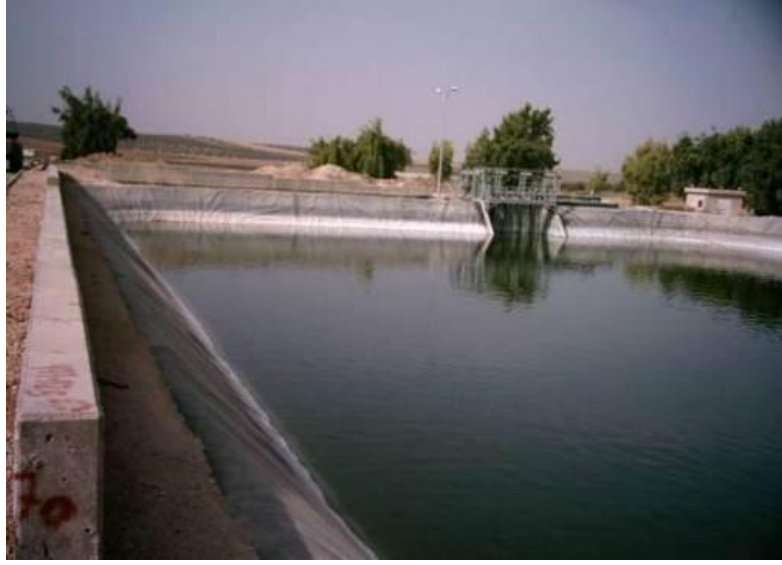
مياة صرف صحي معالجة