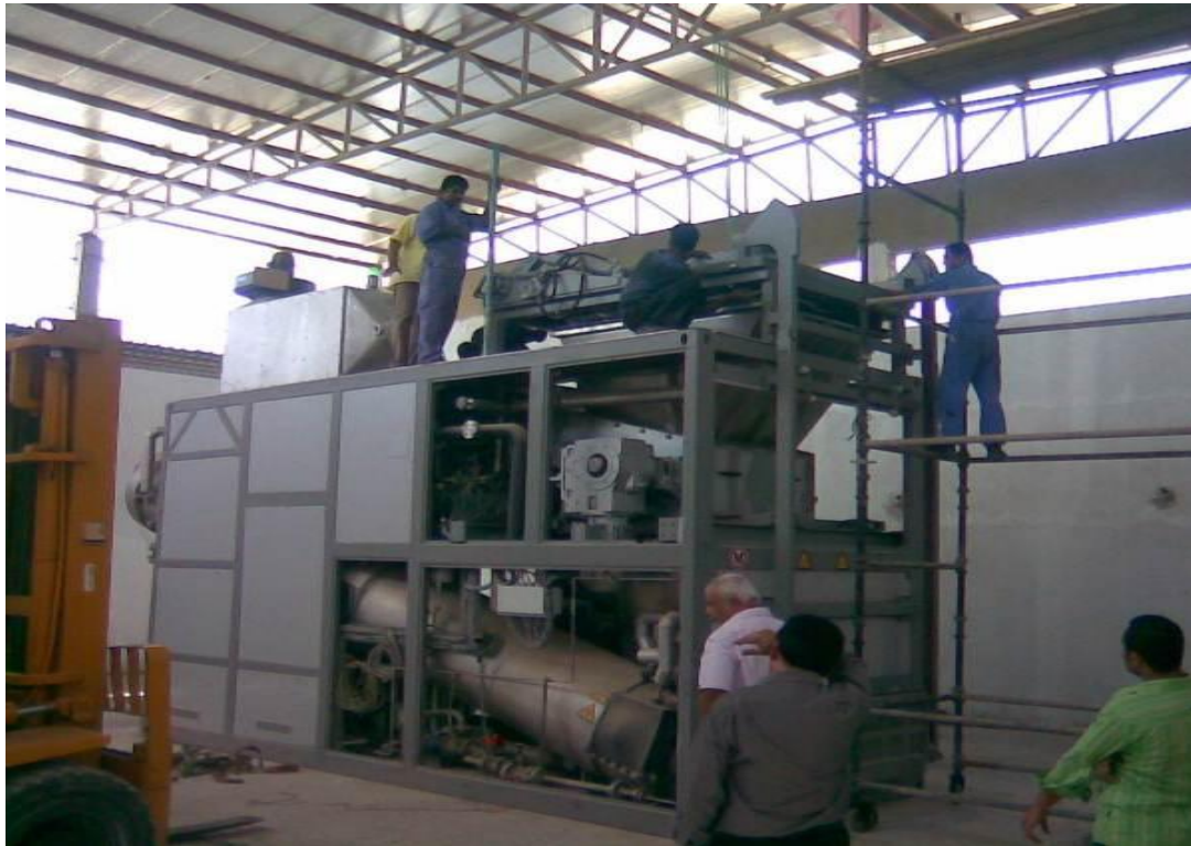
نظام معالجة النفايات الطبية – الشرق الأوسط