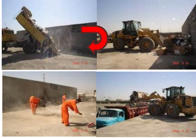
محطة تحويل أولية تعالج 400 طن من القمامة يومياً في بغداد - العراق

يتم عادة إحداث محطات النقل والترحيل عندما تكون المسافة التي تفصل أماكن جمع النفايات عن مركز التخلص النهائي منها تزيد عن 15 كم ويزيد حجم النفايات التي يتم التعامل معها عن 200 طن يومياً. يمكن لمحطات النقل والترحيل أن تزيد من كفاءة عملية جمع النفايات بما يقدر 70% إلى 80% اعتماداً على طريقة حمل وتخزين النفايات ونوعية آليات الجمع.